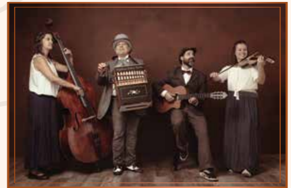
La puntual Folk

Degustació de vins, caves i productes gelidencs a càrrec de Can Pasqual, La Confiança i Mostatxo.