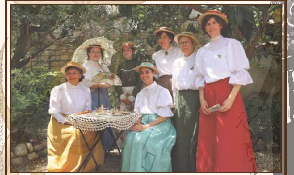
Jornades del Modernisme 2023

7 i 8 de juny de 2024 Patrimoni i indumentària